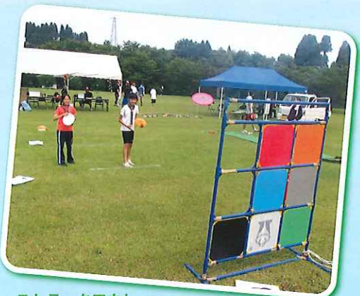
ストラックアウト